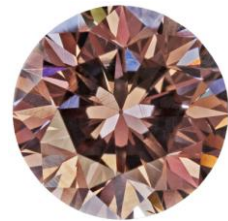
Fancy Brownish Pink

Rohmaterial der Farbe „Purplish Pink“, das vielfach aus der Argyle Mine stammt, ist stärker zoniert als andere Pinkfarben. Dies stellt einen hohen Anspruch an den Schleifer. Je nach Ausrichtung dieser Farbzonen kann der Eindruck des fertig geschliffenen Diamanten stark variieren und den Wert entsprechend beeinflussen.