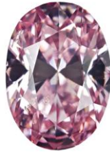
Fancy Intense Purplish Pink