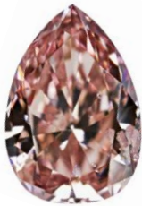
Fancy Orangy Pink

Alle Pinkfarben, ob „Orangy Pink“, „Purplish Pink“, „Brownish Pink“ oder reines Pink, verdanken ihre Hauptfarbe einer Verschiebung des Kristallgitters. Die Intensität dieser plastischen Deformation ist verantwortlich für die Farbsättigung. Diamanten in der Farbnuance „Orangy Pink“ sind selten stark gesättigt.