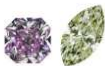
Exemple de contraste complémentaire avec la couleur tendance Digital Lavender et un vert tendre : Fancy Intense Purple & Fancy Grayish Green

Contraste de quantité : il est créé par la juxtaposition de surfaces colorées de tailles différentes. Par exemple, un bijou serti de diamants jaunes en grande pavé avec au centre un petit diamant bleu n'a pas le même effet que son inverse.