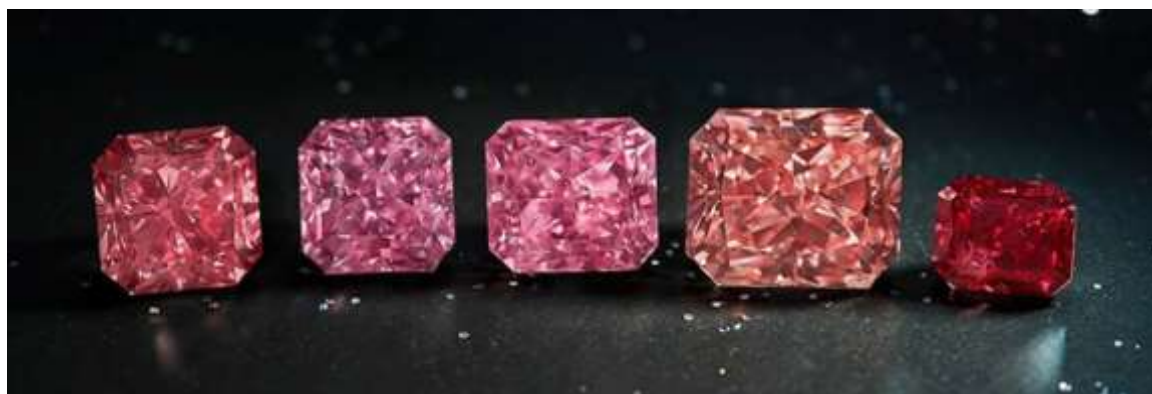
"Hero" diamants

Les enchères pour les diamants roses Argyle de la collection de cette année ont permis de battre des records de prix pour les diamants individuels et pour la collection dans son ensemble. Les diamants ont été âprement disputés dans le monde entier lors d'une série de visionnements virtuels ou en direct.