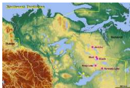
Situation de Diavik Mine.

Dans cette région, les recherches ont commencé en 1992, le chantier de la mine a démarré en 2001 et l'extraction de diamants a débuté en janvier 2003. Avec ses 700 employés, la mine représente un facteur économique important pour la région et elle extrait 8 000 000 de carat de diamant par an (1,6 tonnes). Sa période d'activité est évaluée à une durée de 16 à 22 ans.