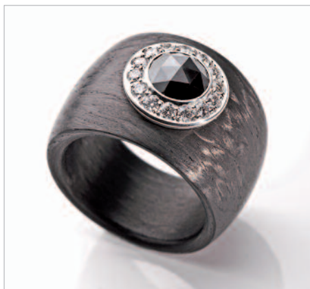
Ring von der Firma Schwab/Winterbach (Carbon, Platin 950, schwarzer Diamant 1,54 ct, Brilliant 0,42 ct).

Depuis quelques années, les diamants noirs sont très appréciés. Ils représentent une alternative abordable et contrastent avec le blanc et les tons de brun. La demande en diamants noirs de couleur naturelle dépasse largement l'offre. C'est la raison pour laquelle les pierres ayant subi un traitement thermique dominant aujourd'hui le marché mais aussi parce qu'elles sont plus faciles à polir.