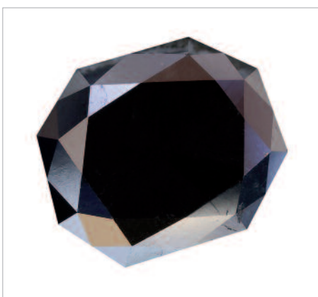
Diamant mit Fantasieschliff, schwarz erhitzt. Taille fantaisie noir chauffé.

Black Orloff pesant à l'origine 195 carats, aurait été dérobé à l'ornement d'un temple hindouiste. La pierre arriva en Russie et fut acquise par la princesse Nadia Vyegin Orloff. Puis, Charles Winson l'acheta en 1947 par des voies jusque-là assez méconnues. Celui-ci cliva la pierre en trois parties et la vendit 22 ans plus tard en taille coussin de 67.50 carats pour 300 000 USD à un acquéreur inconnu.